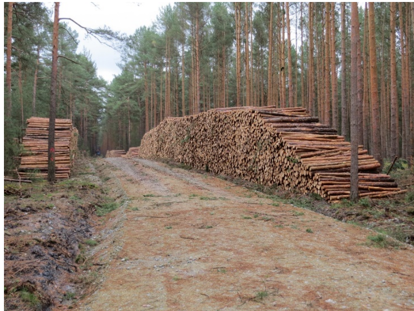
Abbildung 3: Beispiel für einen Abfuhrweg/Fahrweg; der Neubau ist als Eingriff zu bewerten

Der Ausbau von Fahrwegen bis zum forstlichen Standard kann bei einer Fahrbahnverbreiterung über 50 cm oder bei biotop-, artenschutzrechtlichen und Natura 2000-Betroffenheiten sowie Betroffenheit organischer Grundwasserböden einen Eingriff darstellen.