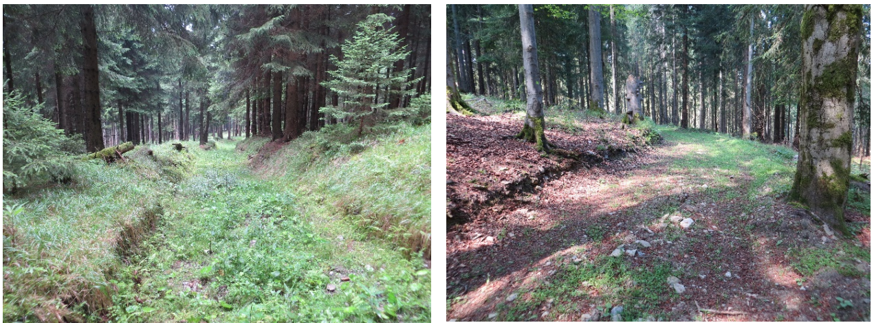
Abbildung 4: Beispiele für Maschinenwege ohne Materialeintrag – diese sind nicht als Eingriff zu bewerten

Maßnahmen der Feinerschließung im Wald (Anlage von Maschinenwegen, Rückegassen, Seiltrassen) sind in der Regel keine Eingriffe. Die Feinerschließung orientiert sich grundsätzlich an standörtlichen und naturräumlichen Gegebenheiten. Eine Übererschließung ist zu vermeiden. Der Bau von Maschinenwegen kann zu einer erheblichen Beeinträchtigung von Natur und Landschaft führen und naturschutzrechtlich zu kompensieren sein. Darunter fallen die unter Kapitel 3 genannten Maßnahmen im Zusammenhang mit Maschinenwegen.