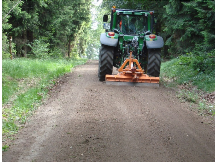
Abbildung 5: Wegeunterhaltung mit Schlepper und Anbaugerät; diese Maßnahme ist kein Eingriff

Bei der Wegeunterhaltung, die eine laufende Pflege mit vorbeugendem Charakter ist (Wegepflege), wird dem Entstehen von Schäden vorgebeugt und einer Ausbreitung von beginnenden Schäden begegnet. Durch regelmäßige Wegepflege ist es möglich, die Deckschicht eines hergestellten Weges länger zu erhalten. Eine fachgerechte Wegepflege erfolgt in der Regel ohne Materialzuführung. Maßnahmen der Wegepflege sind u. a. das regelmäßige Beseitigen von Mängeln der Wegeentwässerung durch die Wiederherstellung einer funktionsfähigen Deckschicht, die Räumung von Gräben und Durchlässen, das regelmäßige Freihalten der Bankette von Bewuchs, z. B. durch Pflegegeräte, Mähen und Mulchen sowie das Freischneiden des Lichtraumprofils.